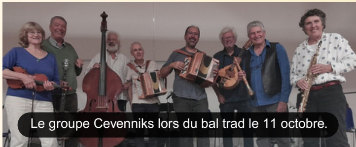
Le groupe Cevenniks lors du bal trad le 11 octobre.

Les prochains mois seront tout aussi bien remplis, avec la pièce de théâtre Le béret et la tortue interprétée par la compagnie Les Santabous, le dimanche 11 janvier 2026 à la salle Guy-Rousset de la commune. Laquelle accueillera par ailleurs l'assemblée générale de l'association le vendredi 23 janvier. Si la date n'est pas encore définitive, Campagn'Art recevra une chorale au mois d'avril prochain dans le cadre de la 33 e édition des Musicales. Ça promet !